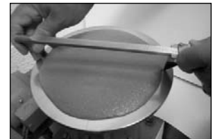
Mesa de Fluidez ( Flujo )

Cuando el grout se le solicita a un productor de concreto premezclado, las especificaciones deberán estar basadas en la resistencia a compresión y la consistencia. La conversión de la dosificación por volumen en dosificación por peso para cada yarda o metro cúbico está sujeta a errores y puede conducir a controversias en el trabajo.